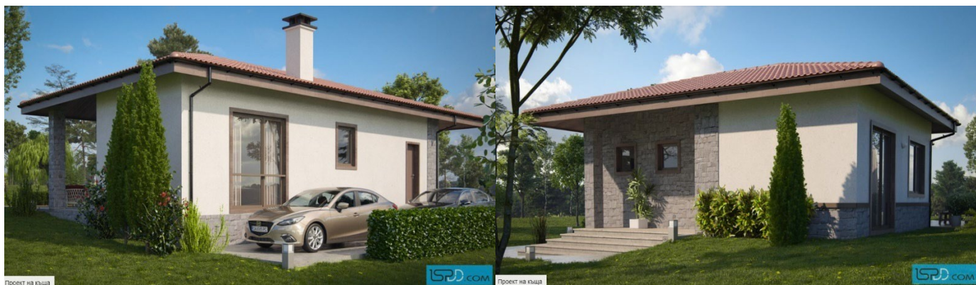
Проект на къща