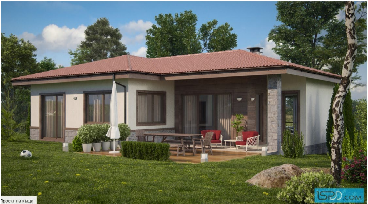
Проект на къща