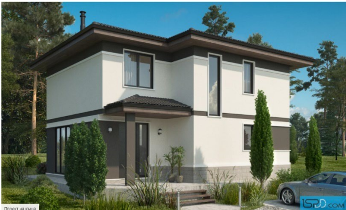
Проект на къща