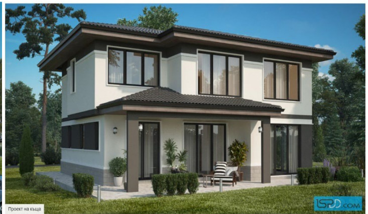
Проект на къща