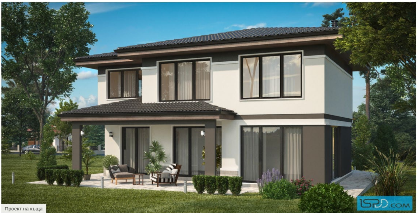
Проект на къща