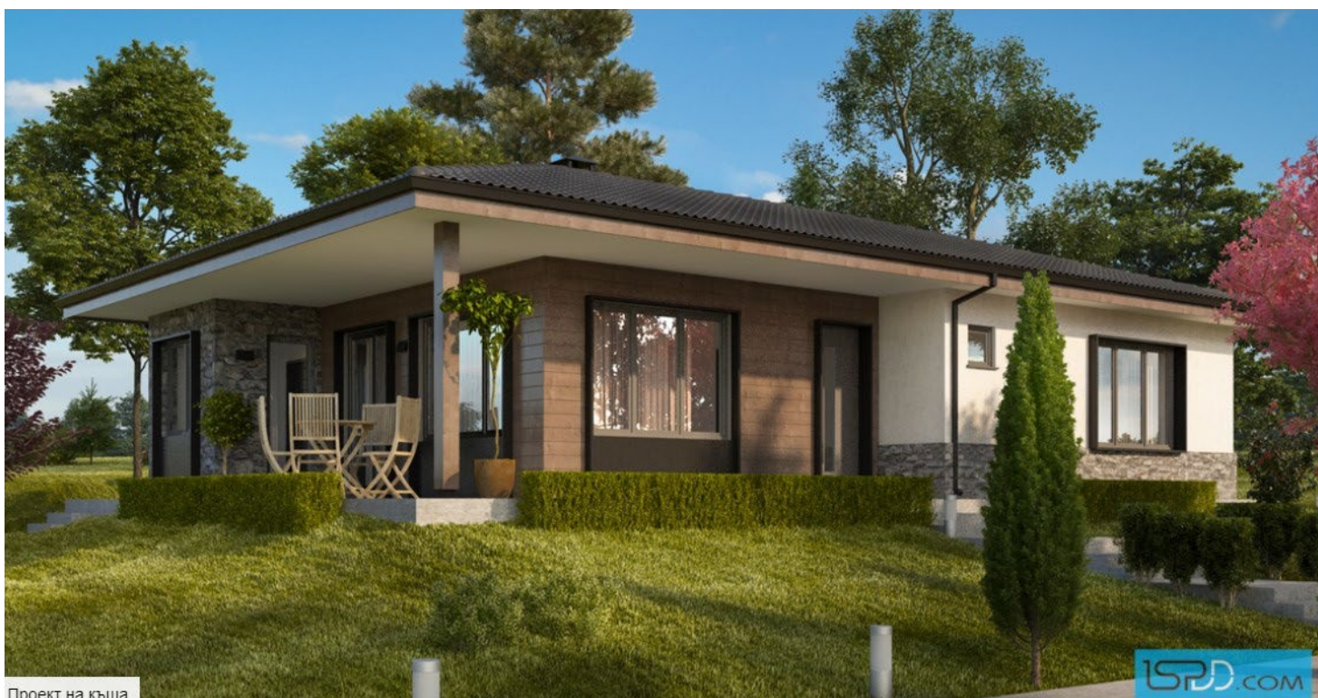
Проект на къща