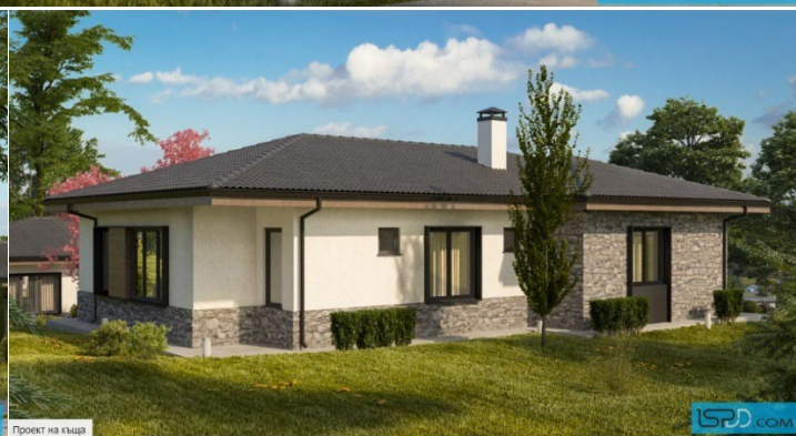
Проект на къща