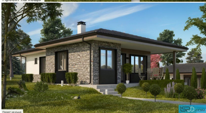
Проект на къща