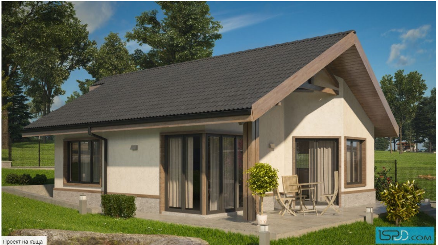
Проект на къща