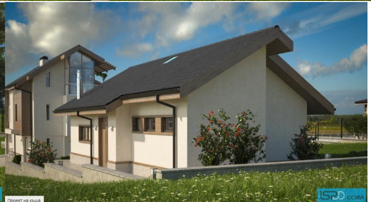
Проект на къща