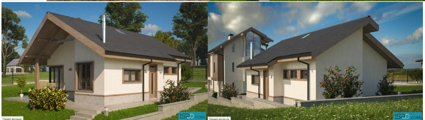
Проект на къща