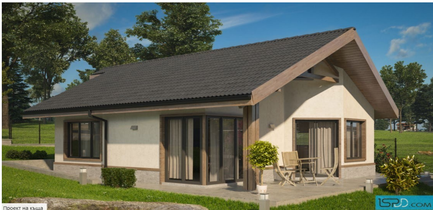
Проект на къща