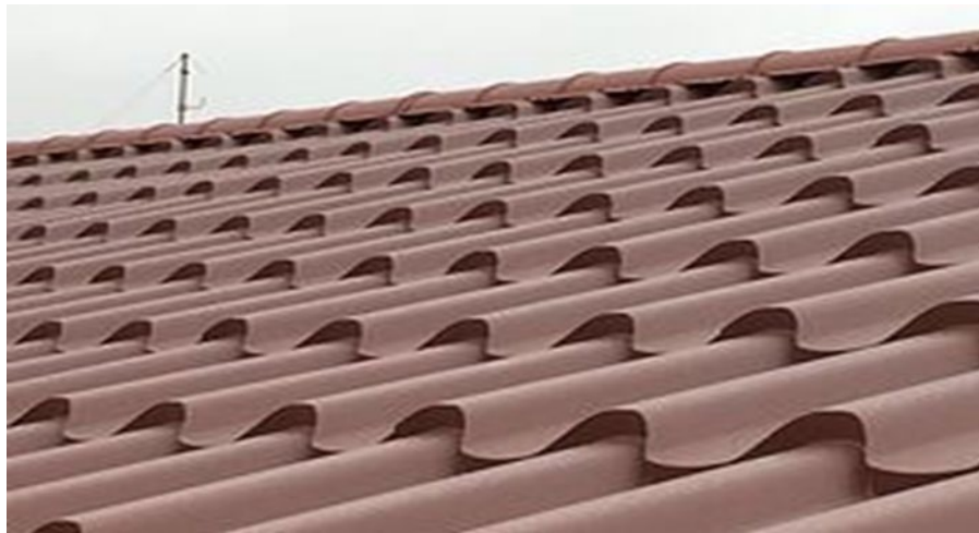
ПОКРИВ ИЗПЪЛНЕН С МЕТАЛНИ ЛИСТОВЕ КЕРЕМИДИ