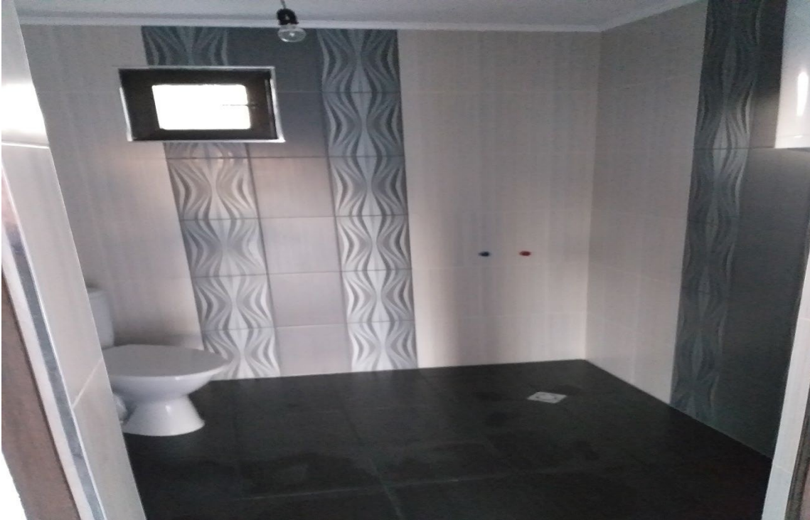
НАПЪЛНО ЗАВЪРШЕНИ САНИТАРНИ ПОМЕЩЕНИЯ

тел: +359896720542 www.valcomfortstroi.com e-mail: office@valcomfortstroi.com