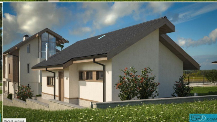
Проект на къща