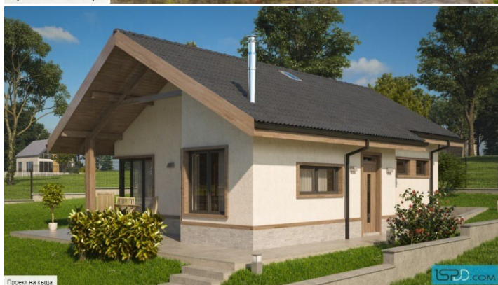
Проект на къща