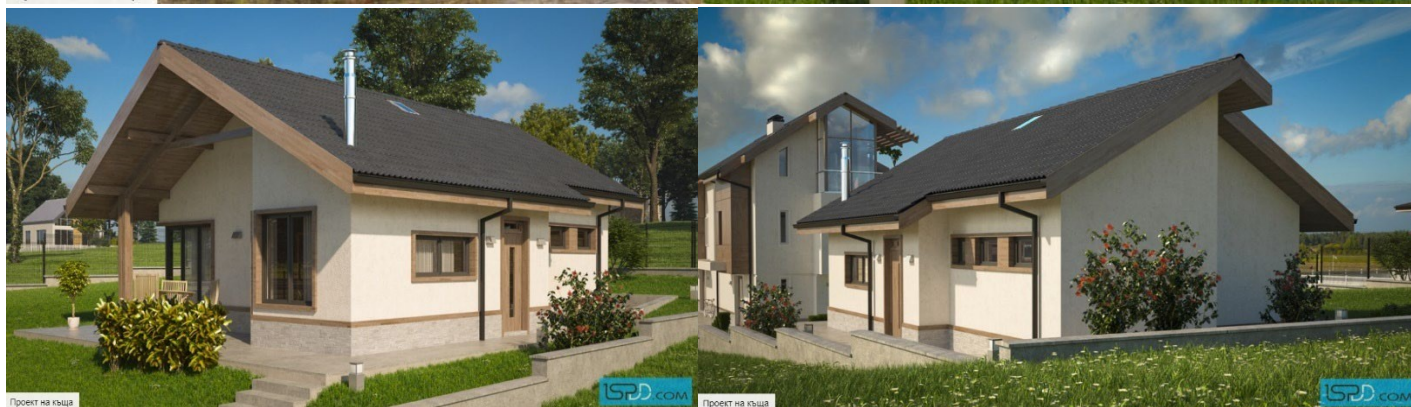
Проект на къща