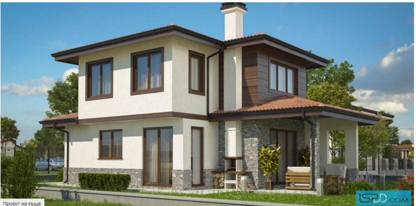
Проект на къща