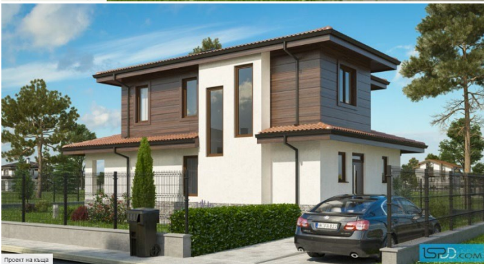
Проект на къща