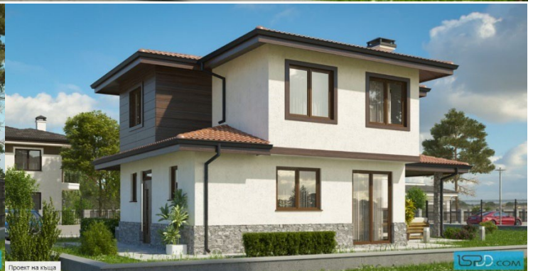
Проект на къща