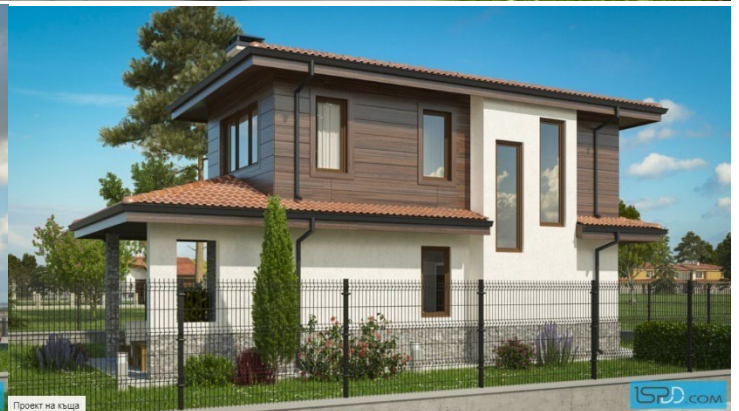
Проект на къща