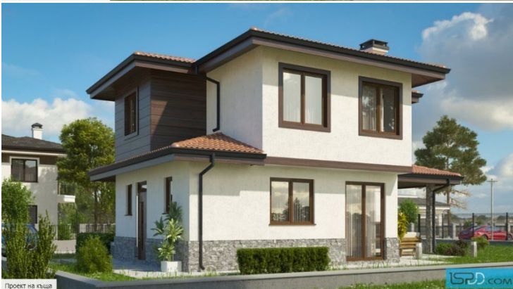
Проект на къща