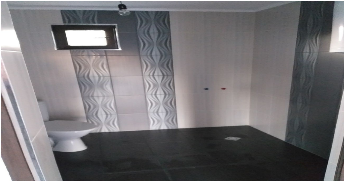
ОБЛИЦОВКА ОТ ГИПСОКАРТОН В ПОМЕЩЕНИЯТА, ПОДОВА ИЗРАВНИТЕЛНА ЗАМАЗКА

тел: +359896720542 www.valcomfortstroi.com e-mail: office@valcomfortstroi.com