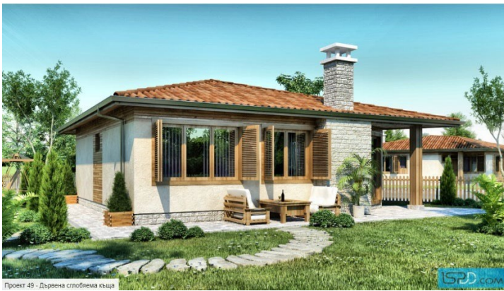
Проект 49 - Дървена сполбена къща