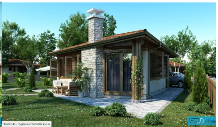
Проект 49 - Дървена сполбена къща

Това е готов проект на малка едноетажна дървена вила. По фасадата са използвани каменна и дървена облицовка и мазилка като целта е къщата да се приобщи към пасторалната среда, за която е проектирана. Едновременно с това визията е съвременна. Очарованието на вилата се създава от дървените елементи по фасадата като кантове около отворите, капаци по прозорците и дървените колони. Търсено е балансирано отваряне на къщата към двора като витрините са отстъпили място на прозорците. Акцент в челната фасада е каменната стена на камината, която прорязва къщата във вертикала. Във вилата са проектирани входно антре, дневна с кухненски бокс и кът за хранене, две спални, баня и склад. Конструкцията е дървена скелетна. Ограждащите стени са многослойни с междинна и с външна топлоизолация. Фасадното оформление включва каменна облицовка от плочи гнайс, дървена облицовка и цветна минерална мазилка. Дограмата е PVC със стъклопакет от нискоемисионно стъкло. Покривът е четирикатен покрит с метални керемиди.