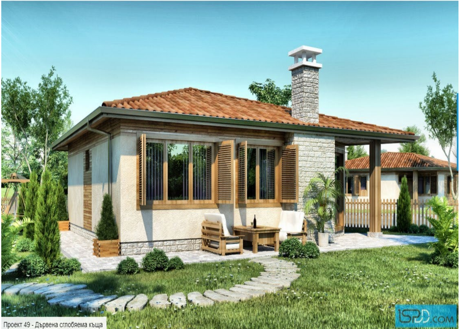
Проект 49 - Дървена сглобяема къща

НАПЪЛНО ЗАВЪРШЕНА ФАСАДА С ВСИЧКИ ФАСАДНИ ДЕТАЙЛИ ПО ПРОЕКТ