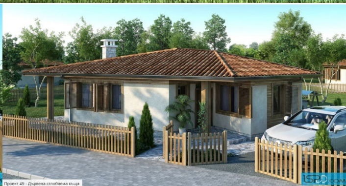
Проект 49 - Дървена сглобяема къща