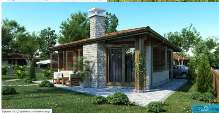
Проект 49 - Дървена сглобяема къща