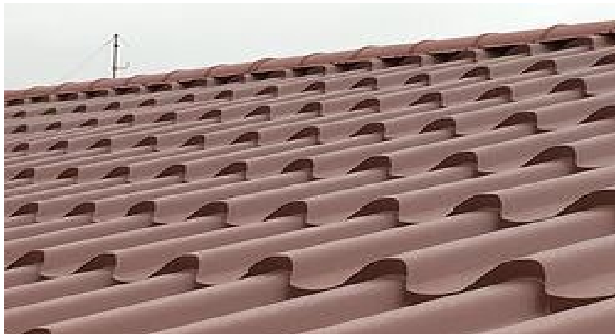
НАПЪЛНО ЗАВЪРШЕН ПОКРИВ С МЕТАЛНИ ЛИСТОВЕ КЕРЕМИДИ