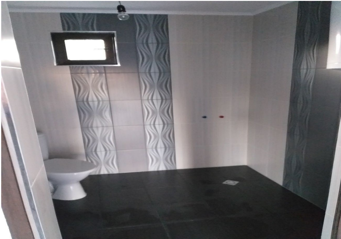
НАПЪЛНО ЗАВЪРШЕНИ САНИТАРНИ ПОМЕЩЕНИЯ

тел: +359896720542 www.valcomfortstroi.com e-mail: office@valcomfortstroi.com