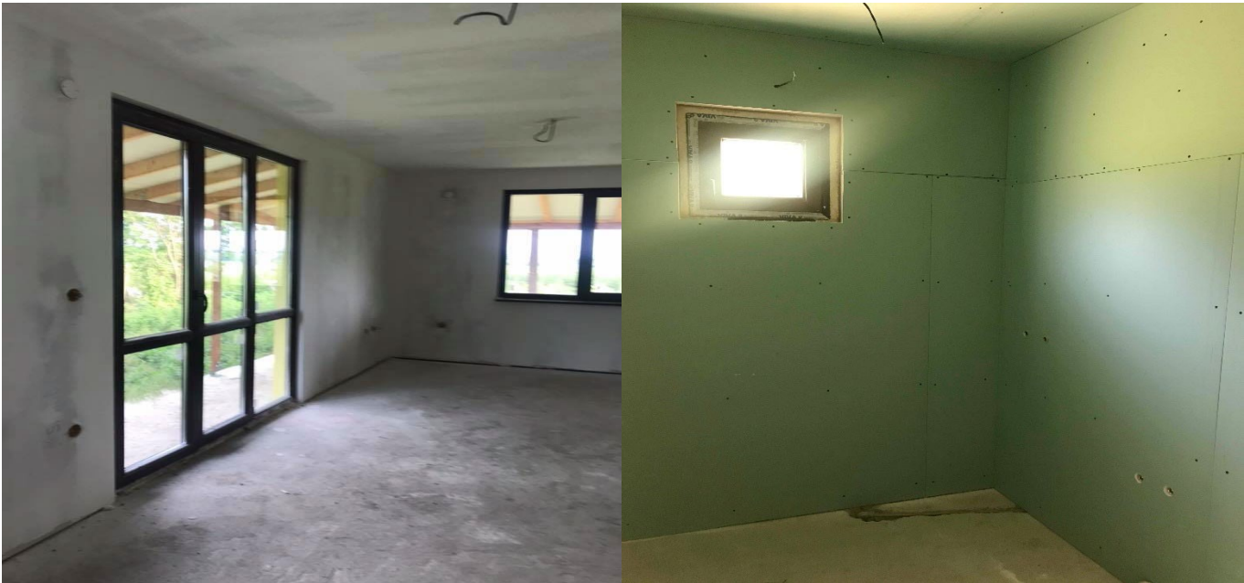
ОБЛИЦОВКА ОТ ГИПСОКАРТОН В ПОМЕЩЕНИЯТА , ПОДОВА ИЗРАВНИТЕЛНА ЗАМАЗКА

тел: +359896720542 www.valcomfortstroi.com e-mail: office@valcomfortstroi.com