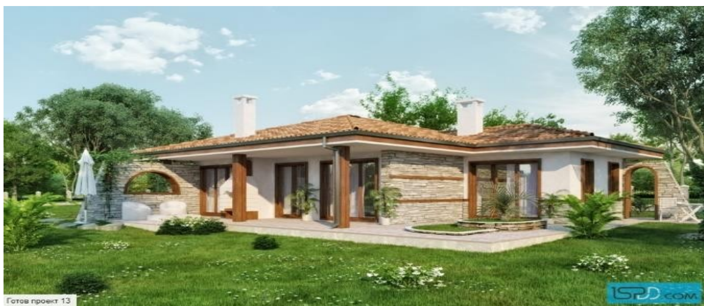
Готов проект 13