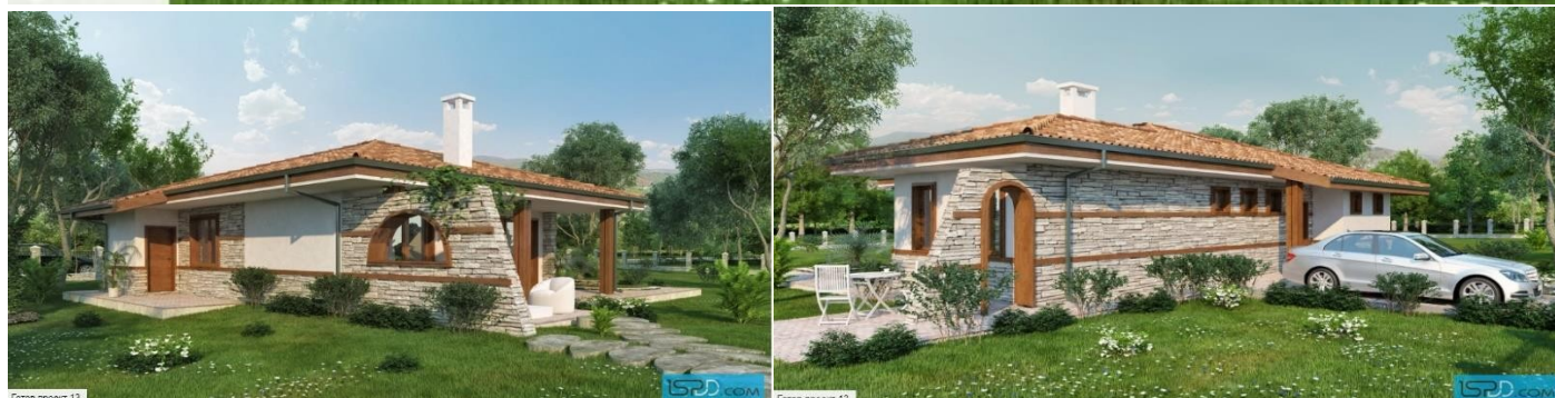
Готов проект 13