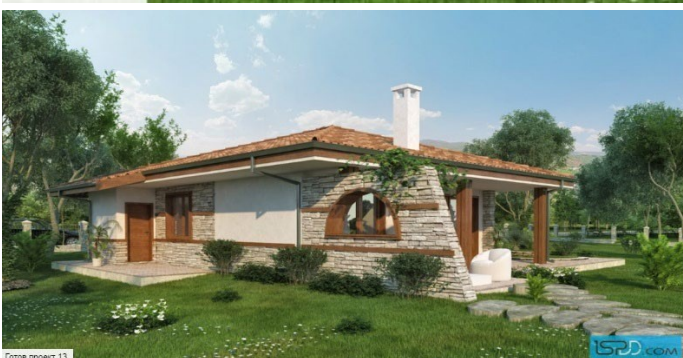
Готов проект 13