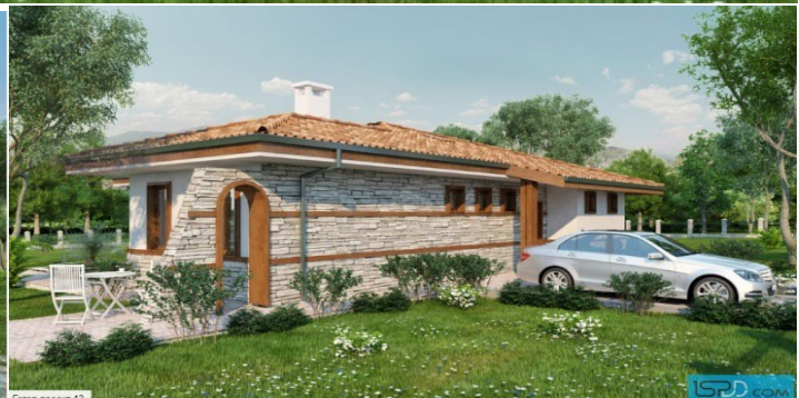
Готов проект 13

Това е еднофамилна къща предназначена за цялогодишно ползване. Проектирани са всички спомагателни помещения – склад, гардеробно, перално, необходими за безпроблемното обитаване във всеки сезон. Къщата е едноетажна, с традиционни материали. Използвана е комбинация от каменна облицовка с дървени сантрачи и бяла мазилка. Дневната зона е с обособени кътове за мека мебел, трапезария и кухненски бокс. При желание кухнята може да се обособи като самостоятелно помещение. Разработени са две спални със среден размер. От жилищните помещения се излиза на обширна веранда, която е защитена от декоративна стена с арковиден отвор. Проектирано е външно барбекю, което е ориентирано към дневната зона.