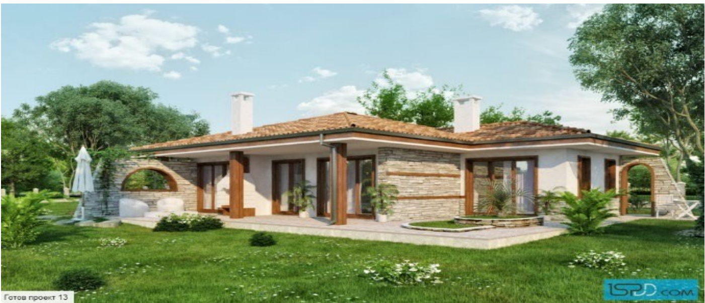
Готов проект 13